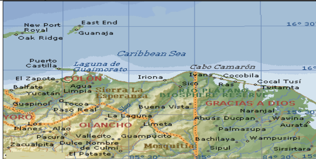
FIGURA I: Mapa, Costa Caribeña de Honduras

Fuente: Microsoft Encarta Map Point Atlas, 2003.