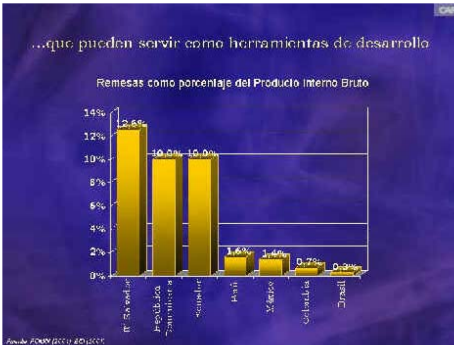
Gráfico N° 3 Flujos de remesas hacia América Latina en perspectiva: países selectos - (% del Producto Interno Bruto)

Actualmente se sabe que las disparidades en los niveles de desarrollo y oportunidades de trabajo entre países y regiones son causas fundamentales de la migración interna. Mientras éstas no se reduzcan o incluso desaparezcan, los flujos migratorios también tenderán a permanecer.