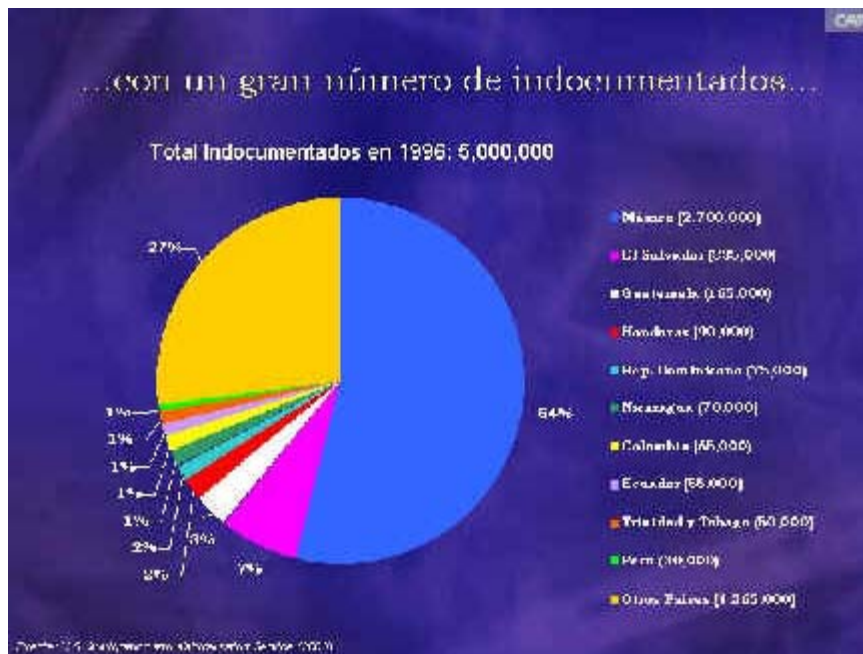
Gráfico N° 2 Población latinoamericana indocumentada en los Estados Unidos (1996)

Por generaciones, las remesas enviadas por migrantes internacionales han sido fuente importante de soporte económico a sus familias en los respectivos países de origen. Estas se han convertido en un importante flujo de divisas internacionales con implicaciones importantes sobre el consumo y la inversión en países receptores. De acuerdo al Fondo Multilateral de Inversiones (FOMIN) y del Banco Interamericano de Desarrollo (BID), las remesas en América Latina alcanzan alrededor de 25.000 millones de dólares al año y se proyecta que, de continuar con las tasas de crecimiento actuales, el valor de las remesas acumuladas para la siguiente década (2001-2010) podría alcanzar los 300.000 millones de dólares.