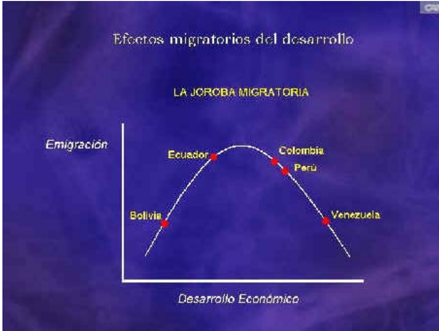
Gráfico N° 4 Efectos migratorios del desarrollo: la joroba migratoria

Sin embargo, el éxito de tales esfuerzos integradores, como postula el efecto de la "joroba migratoria", depende de una gran diversidad de factores.